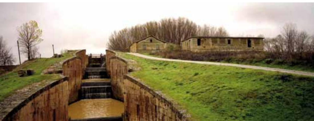
Eduardo Margareto Esclusas del Canal de Castilla en Fromista (Palencia)