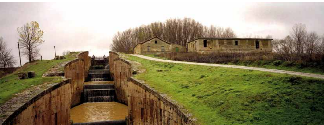
Eduardo Margareto Esclusas del Canal de Castilla en Fromista (Palencia)