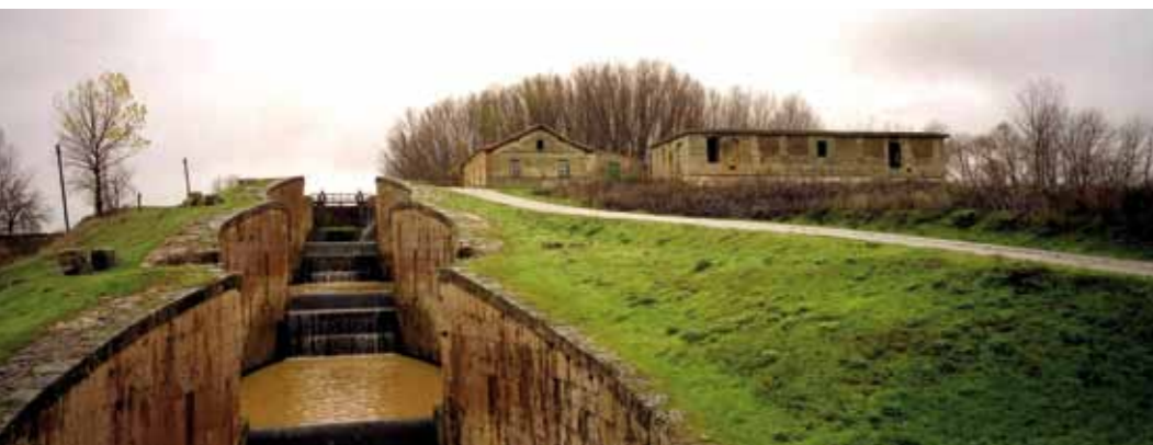
Eduardo Margareto Esclusas del Canal de Castilla en Fromista (Palencia)