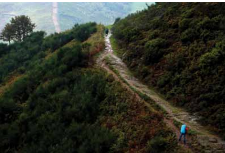
Francisco J. de las Heras Último tramo de la subida al Cebreiro, El Bierzo (León)